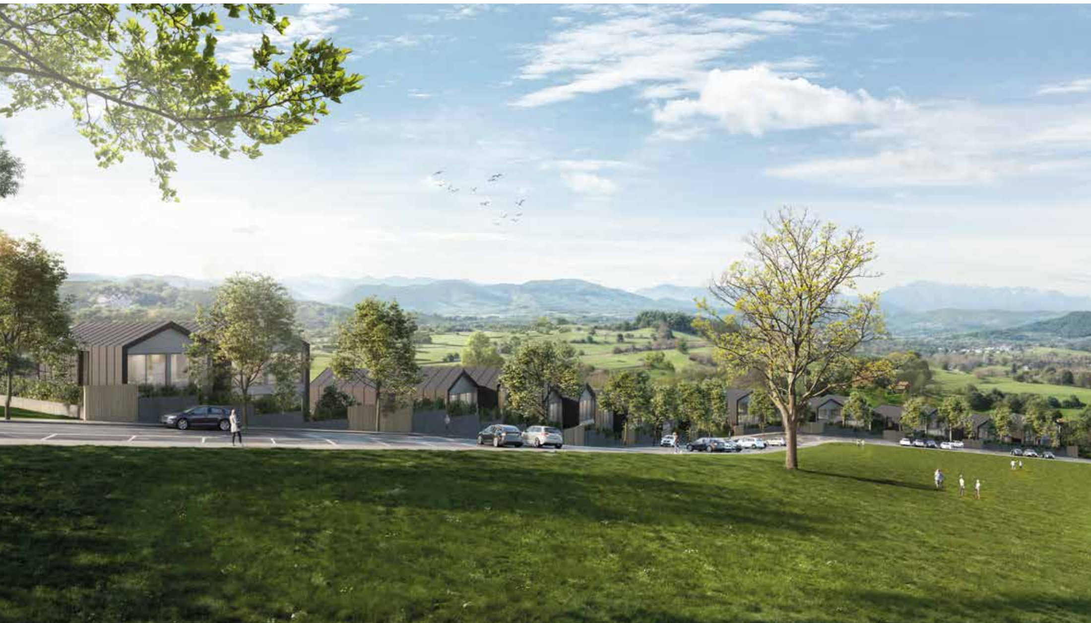
Rumoroso Polanco Cantabria