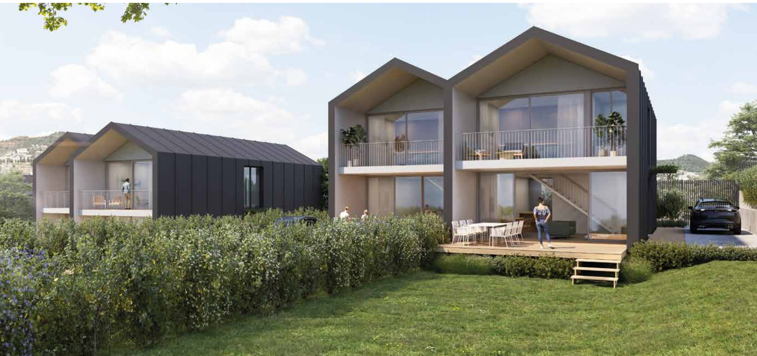
La terraza, parcialmente techada, y el amplio jardín harán las delicias de la familia.