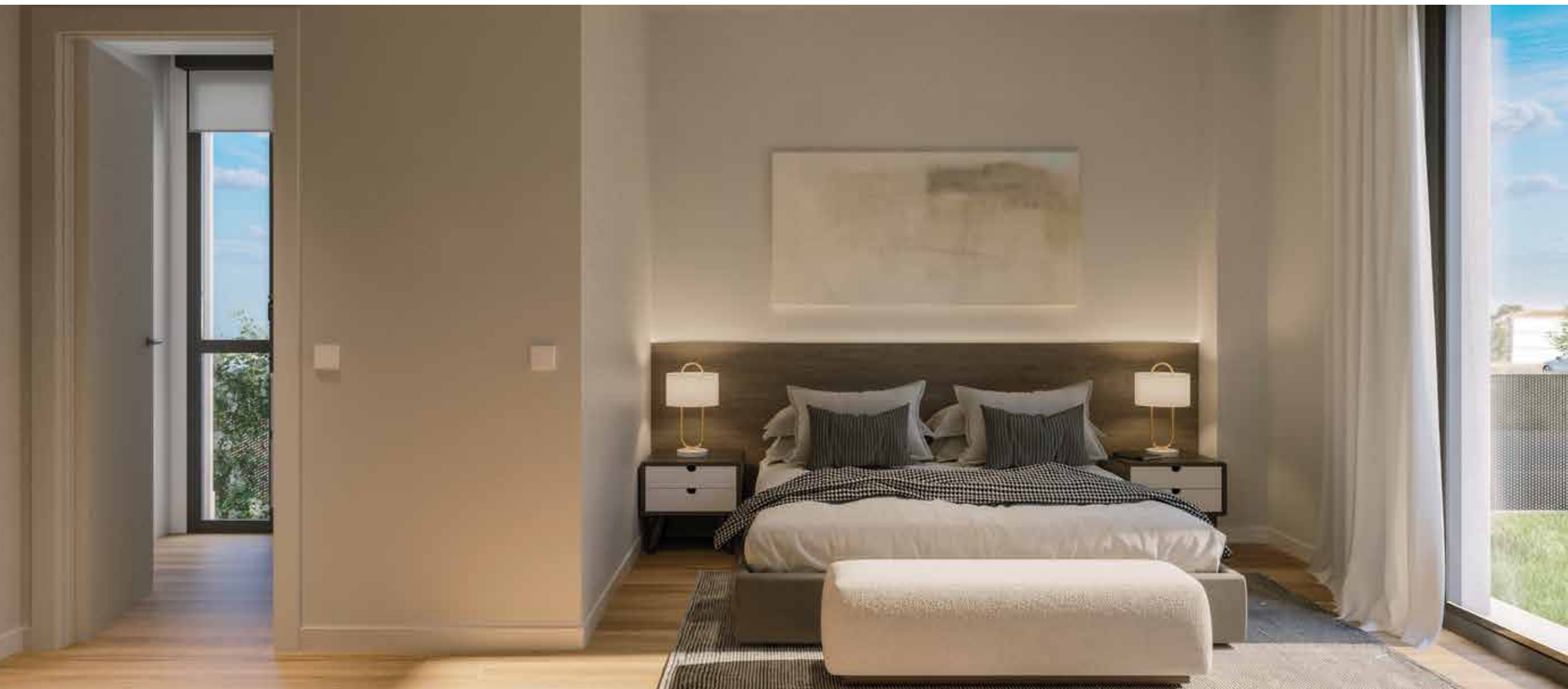
Confortable dormitorio principal con baño en suite.