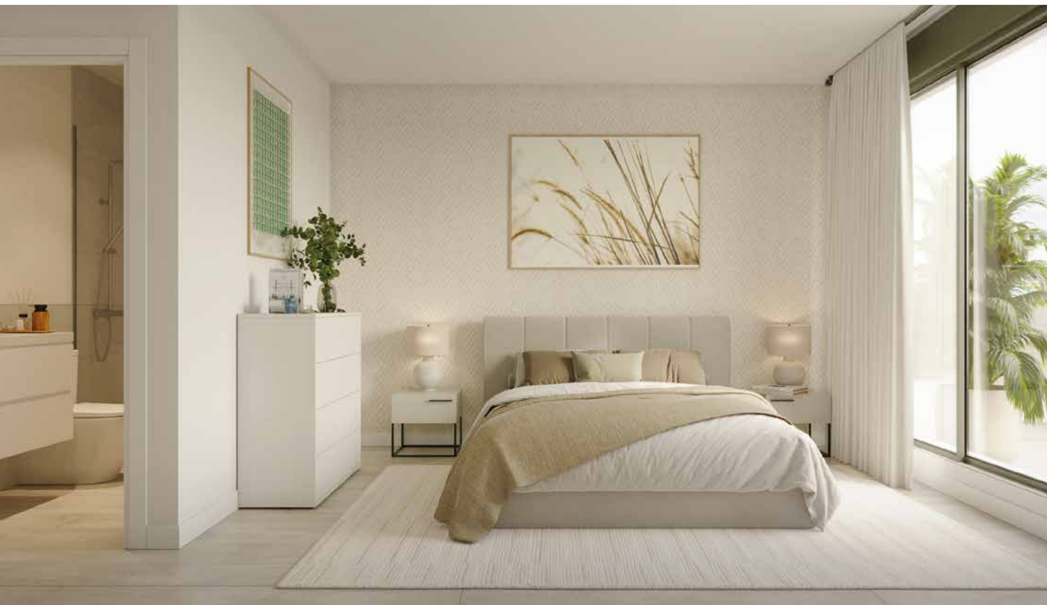
Confortable dormitorio principal con baño en suite.