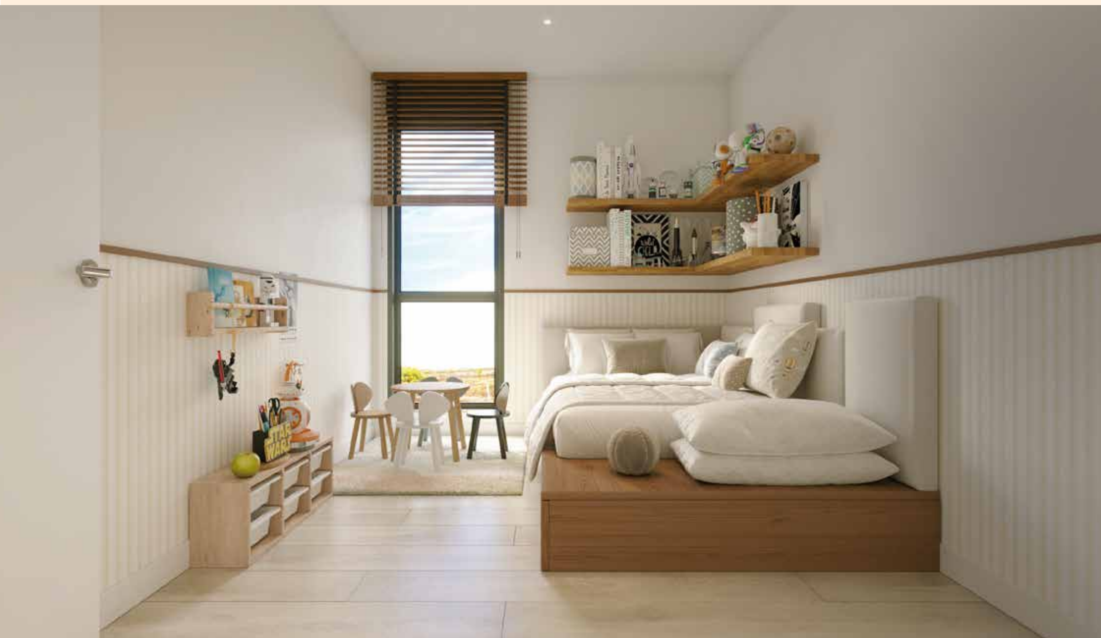
Dormitorios secundarios que se adaptan a tus necesidades.