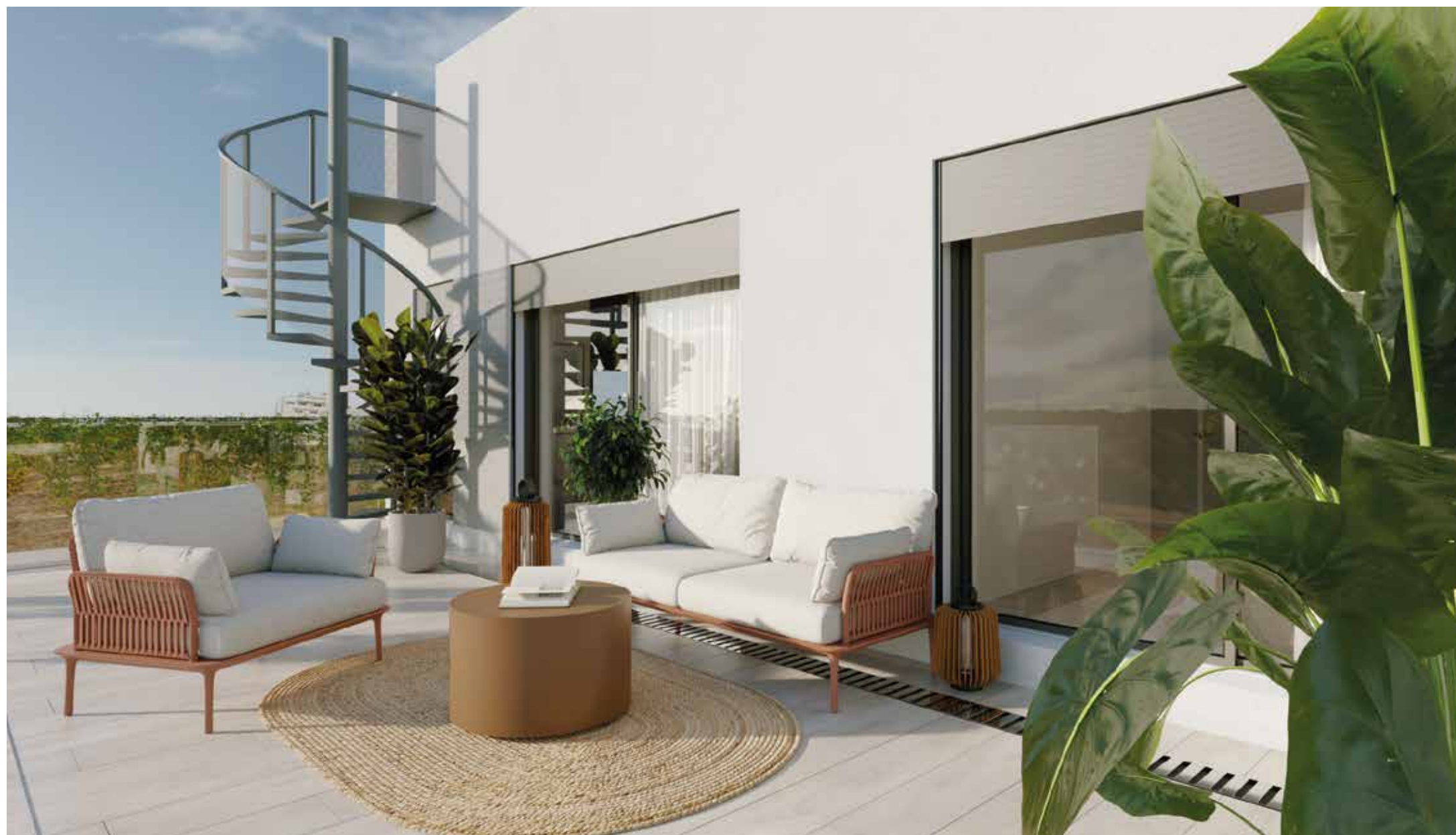
Amplias terrazas para disfrutar de un entorno amable y vibrante.