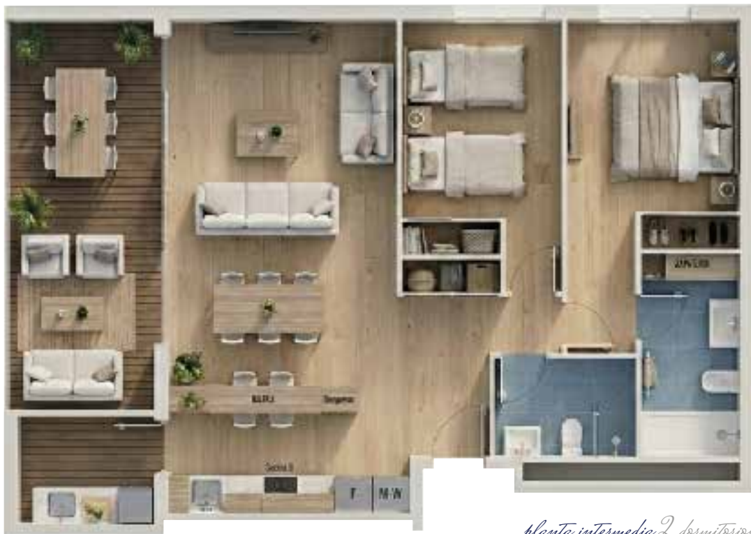
planta intermedia 2 dormitorios